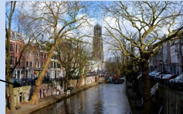
Utrecht et sa cathédrale