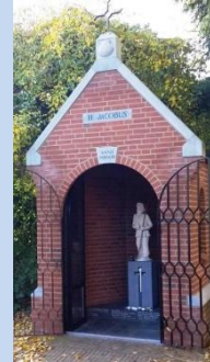
Roermond : Jacobskapelle