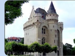
Porte de Hal à Bruxelles d'où partent les pèlerins