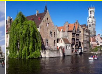
Le centre de Bruges