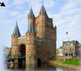
Porte d'Amsterdam à Haarlem, point de départ des pèlerins

Le Luxembourg se trouve sur un grand Chemin de Compostelle reliant Trèves, en Allemagne, à Verdun. La vieille ville de Luxembourg et ses fortifications sont classées au Patrimoine Mondial.