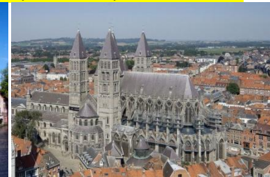
La cathédrale N. Dame de Tournai