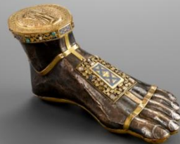
Reliquaire du pied de Saint Jacques à Namur

En Belgique , les Chemins de Compostelle connaissent aujourd'hui un grand engouement, tant dans les zones francophones que néerlandophones. Classés au Patrimoine Mondial, plusieurs monuments ou sites, non en rapport direct avec les Chemins de Saint Jacques, mais néanmoins sur le tracé des pèlerins depuis des siècles.