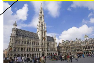
La Grand Place à Bruxelles

En Belgique , les Chemins de Compostelle connaissent aujourd'hui un grand engouement, tant dans les zones francophones que néerlandophones. Classés au Patrimoine Mondial, plusieurs monuments ou sites, non en rapport direct avec les Chemins de Saint Jacques, mais néanmoins sur le tracé des pèlerins depuis des siècles.